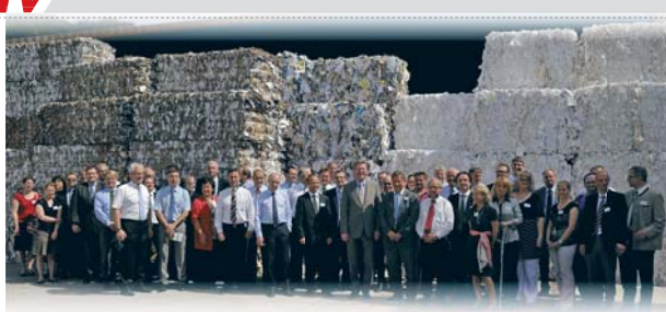
Experten aus verschiedenen Branchen: Fast 40 Projektpartner, darunter Unternehmen wie Henkel und SCA Packaging sowie Verbände und Kommunen, haben sich an den Diskussionsrunden beteiligt.