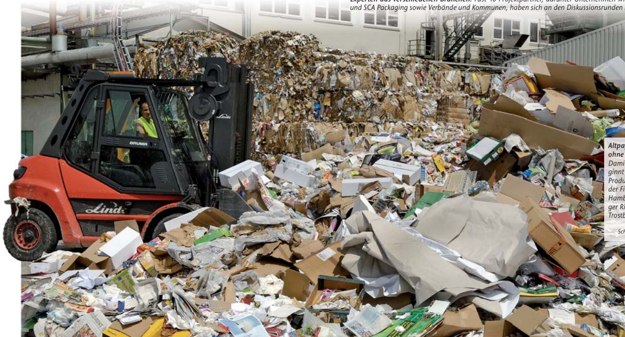
Altpapier ohne Ende: Damit beginnt die Produktion der Firma Hamburger Rieger in Trostberg.